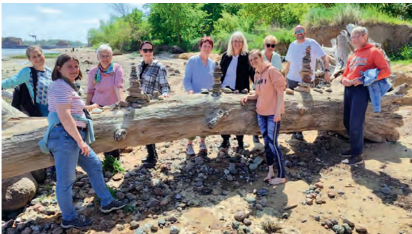
Ein Tag voller neuer Eindrücke: Die Mitarbeitenden bei der Mini-Pilgertour der Diakonie Nord Nord Ost.

Interesse an solchen Fortbildungen und weiteren Benefits? Alles rund um den Job bei der Diakonie Nord Nord Ost gibt es unter: www.diakonie-nordnordost.de/karriere .