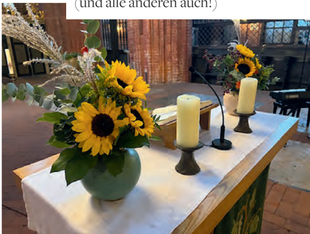
Kurz vor Beginn des Gottesdienstes.

So schön sah es aus zum Landeserntedankfest!! Danke an die wunderbaren Frauen, die das gezaubert haben. Landrätin und Landesbischöfin waren ganz begeistert (und alle anderen auch!)