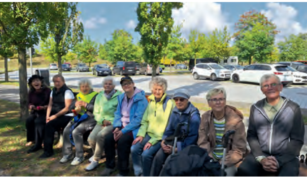
Rückblick September 2025: Rast auf dem Pilgerweg.

Bei wunderschönem Wetter sind wir zum Aussichtsturm im Bürgerpark gepilgert. Mit Ps. 123 und dem Pilgerlied: „Unsre Augen schauen auf den Herrn, unsern Gott, bis er uns gnädig ist.“