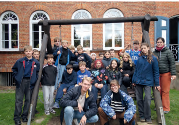
Konfi-Wochenende in Meetzen.

21 Konfis, ein Wochenende in Meetzen und mittendrin die Frage: Worauf kann ich mich verlassen? Auf wen kann ich vertrauen... und wer verlässt sich auf mich? Zwischen Spielen, Gesprächen und Andachten entstand das, was am Anfang jeder guten Gemeinschaft steht: Vertrauen.