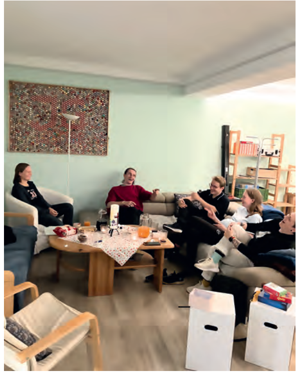
Treffen ZwischenMenschen – ZwiMe.

Man kommt neu in eine Stadt, startet ein Studium, zieht um und merkt plötzlich: So richtig angekommen ist man noch nicht. Genau dafür gibt's ZwiME –Zwischen-Menschen. Reden, Kochen, Kennenlernen. Ein Ort, wo etwas zwischen Menschen entstehen darf.