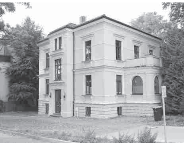
Das Beratungszentrum des Diakoniewerks in der Dr.-Leber-Straße.