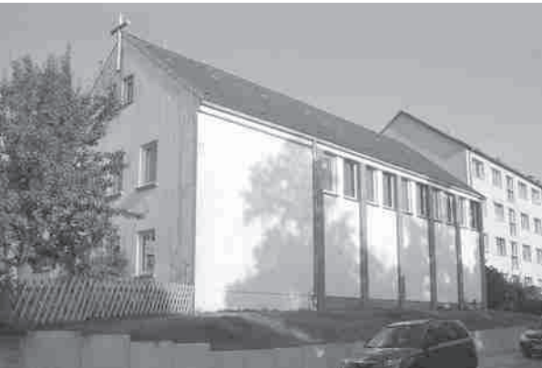
Kirche Wendorf

52 Jahre ist das Haus der Begegnung in Wismar-Wendorf nun alt. Wir sind dabei, das Haus gründlich zu sanieren und