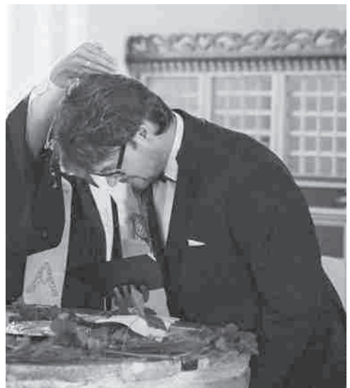
Eine Taufhandlung 22. Juli 2018

Zu Kasualien und Segenshandlungen gibt Ihnen gerne jede Pastorin / jeder Pastor Auskunft. Kontaktdaten finden sie auf Seite 33.