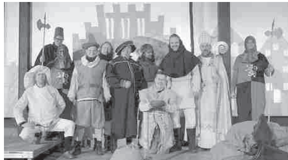
Männergruppe von St. Nikolai: Nikolauspiel aus dem Vorjahr

Die Männergruppe hat wieder ein Spiel entwickelt und geschrieben. Die Proben haben begonnen – mit einem Drachen und sehr viel Spaß! Die Kinder können am 6.12. einen Schuh am Eingang der Kirche abgeben. Beginn 16.30 Uhr