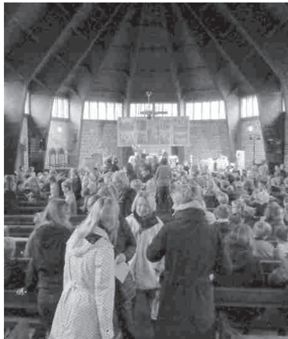
Vorbereitung Erntedankgottesdienst in der Neuen Kirche