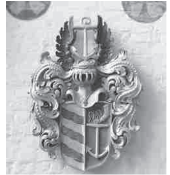
Der restaurierte Epitaph