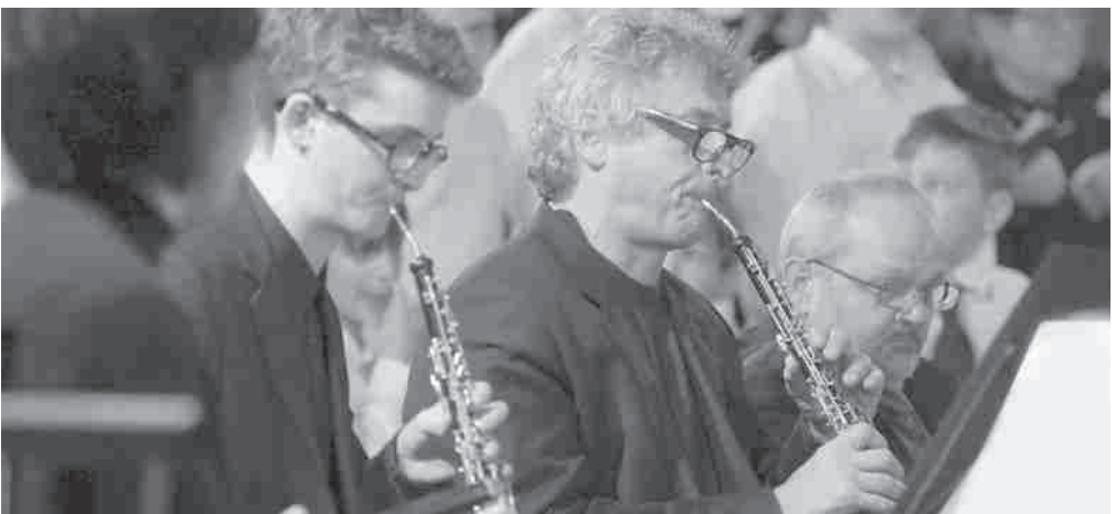
Chorsinfonik in Wismar – viele Höhepunkte im neuen Kirchenjahr