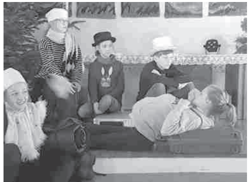
Krippenspiel der Konfirmanden Foto 2017 in der Kirche Wendorf

Sie treffen sich zu einem Probenwochenende vom 14.–16. Dezember in Heiligen Geist und gestalten den Gottesdienst am 3. Advent mit.