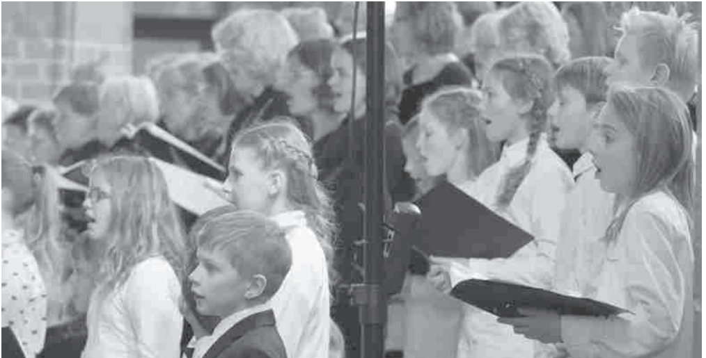
Die Kinderchöre der Kantorei freuen sich über Verstärkung! Ein Einstieg ist jederzeit möglich!