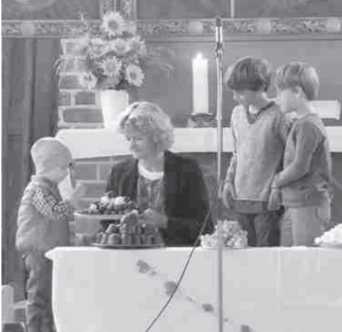
Essen beim Willkommensgottesdienst