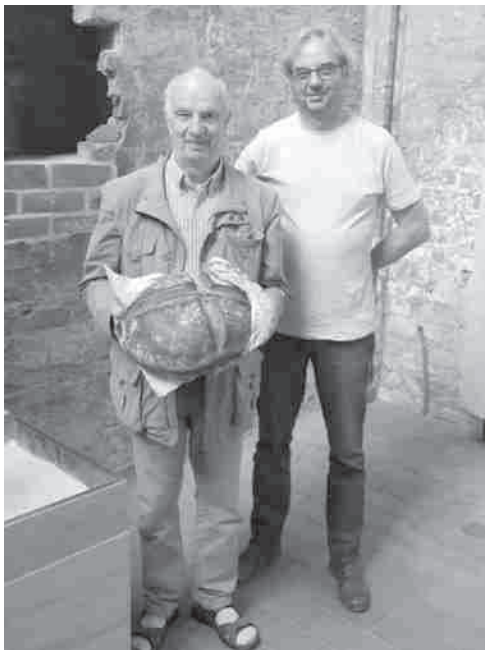
Das Brot für das Abendmahl in Breda

Das Abendmahlsbrot haben wir aus Wismar mitgebracht. Es wurde in der Bäckerei Tilsen gebacken und am Tag vor unserer Reise in der Georgenkirche Wismar gesegnet. Aus der Partnergemeinde Arad kam der Wein.