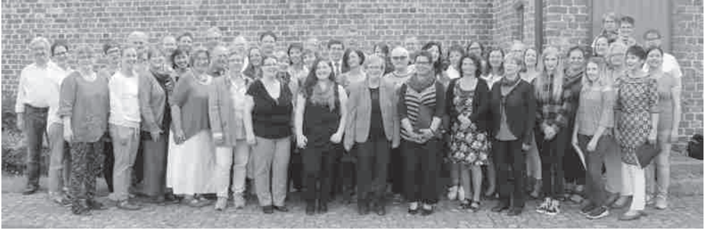
Gospelworkshop – auch 2019 wieder am Start