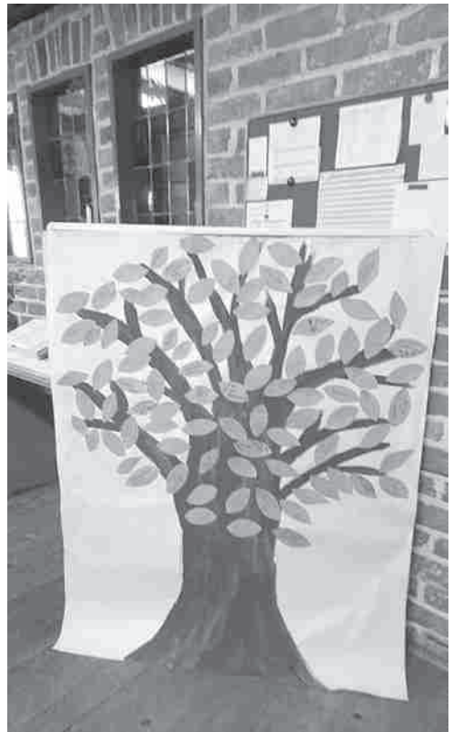
Erntedank 2018 Marien-Georgen