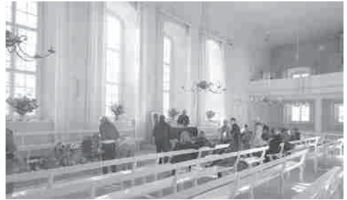
Herrnhut Kirchsaaal

Und zum anderen waren wir auf einem Eheseminar von Team-F ( www.team-f.de ) und konnten in unserem Ehealltag innehalten und neu auftanken. Wir haben schon öfter an solchen Seminaren teilgenommen und erleben es jedes Mal wieder aufs Neue: Der Segen über unserer Ehe wird aufgefrischt. Die Dankbarkeit füreinander wird uns neu bewusst. Dazu kommen diese schönen Seiten: Wir haben Zeit füreinander; frei vom Kochen, Tischdecken, Putzen, Dienstlichem und Telefon. Wir erleben eine gute und wohltuende Zeit mit anderen christlichen Paaren. Als Paar gehen wir Fragen, Impulsen und Gebetsanliegen nach.